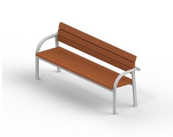
1. Диван на металлических ножках